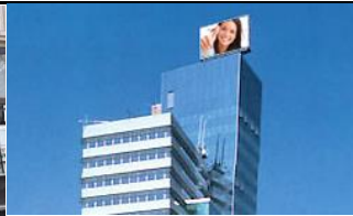
1020, News Tower 560.000 K / Wo, 70m 2 / stnr: 104