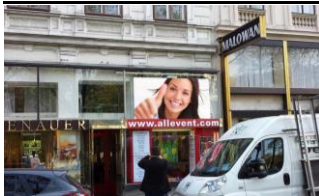
1010, Opernring 350.000 K / Wo, 4,5m 2 / stnr: 102