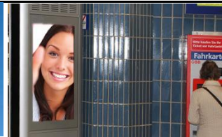
1090, Franz-Josefs-Bahnhof 175.000 K / Wo, 0,5m 2 / stnr: 121