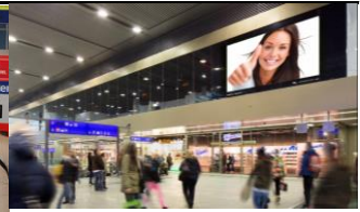
1100, Hauptbahnhof 1.015.000 K /Wo 14m 2 / stnr: 108