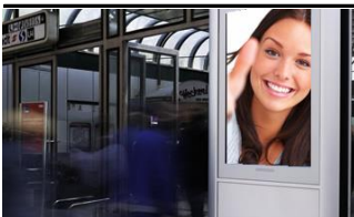
1190, Bahnhof Heiligenstadt 175.000 K / Wo, 0,5m 2 / stnr: 123