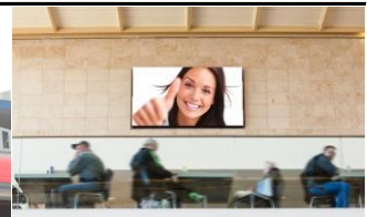
1150, Westbahnhof Haupthalle 525.000 K / Wo, 9,5m 2 / stnr: 103