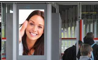
1210, BH Floridsdorf 455.000 K / Wo, 0,5m 2 / stnr: 118