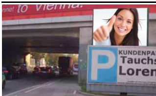
1100, Triester Straße 350.000 K / Wo, 6m 2 / stnr: 106