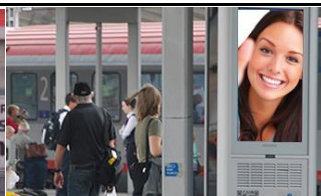
1120, Bahnhof Meidling 175.000 K / Wo, 0,5m 2 / stnr: 124