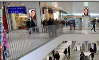
1150, Westbahnhof Bahnsteig 350.000 K / Wo, 5m 2 / stnr: 117