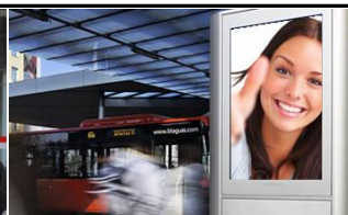
1230, Bahnhof Liesing 175.000 K / Wo, 0,5m 2 / stnr: 122