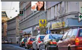
1150, Mariahilfer Straße 245.000 K / Wo, 6m 2 / stnr: 105